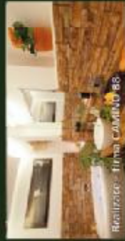
Realizace - firma COMBIO 88