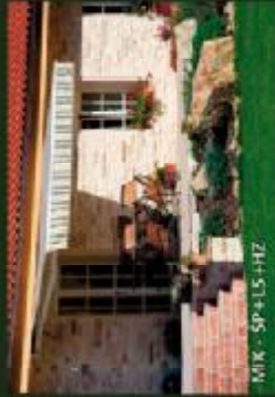
MIK - SP+LS+HZ